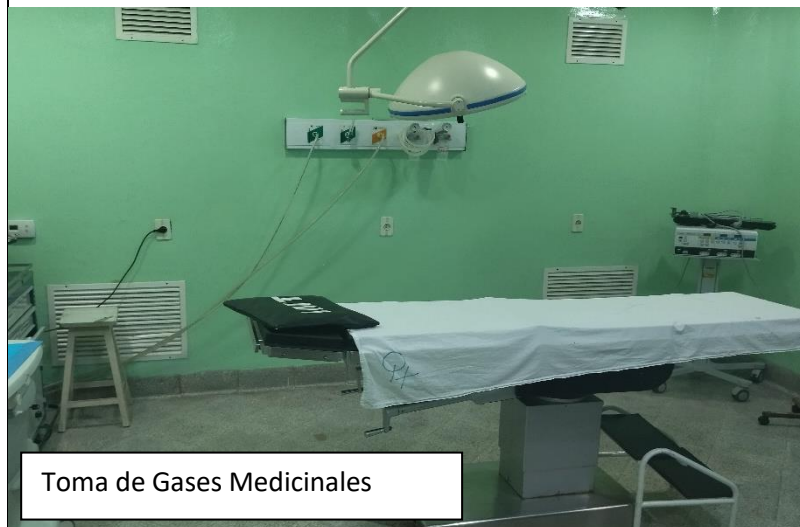
Toma de Gases Medicinales