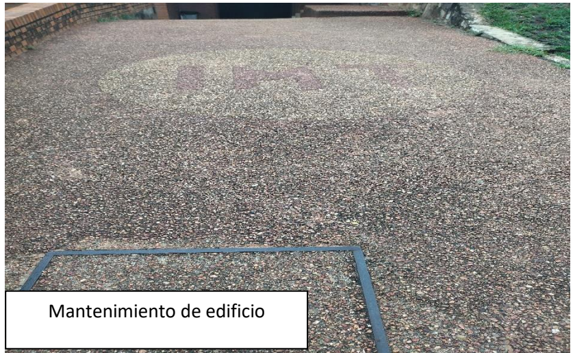
Mantenimiento de edificio